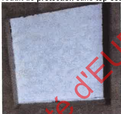
Produit de protection sans top-coat