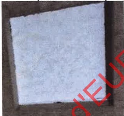
Produit de protection sans top-coat